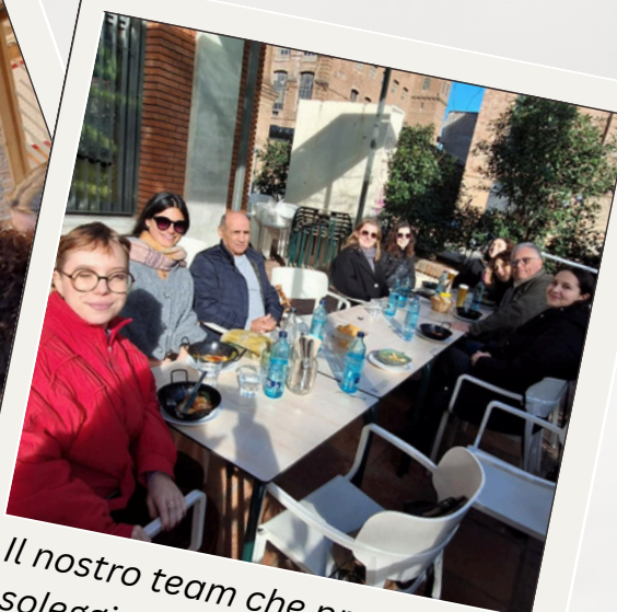
Il nostro team che pranza nella soleggiata Barcellona, Spagna