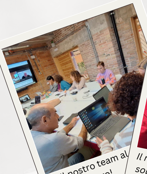
Il nostro team al lavoro!

Il prossimo incontro in presenza è previsto per maggio 2025 in Irlanda!