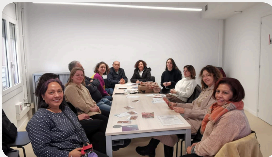
Il team durante il meeting di avvio a Corbera de Llobregat, in Spagna.

I bisogni: il cambiamento demografico e le attuali sfide socio-economiche richiedono riforme urgenti dei sistemi di assistenza. Le persone con fragilità hanno il diritto di dar voce ai propri bisogni e partecipare alle scelte politiche che le riguardano. Allo stesso modo, familiari e caregivers necessitano di supporto per svolgere al meglio il proprio ruolo