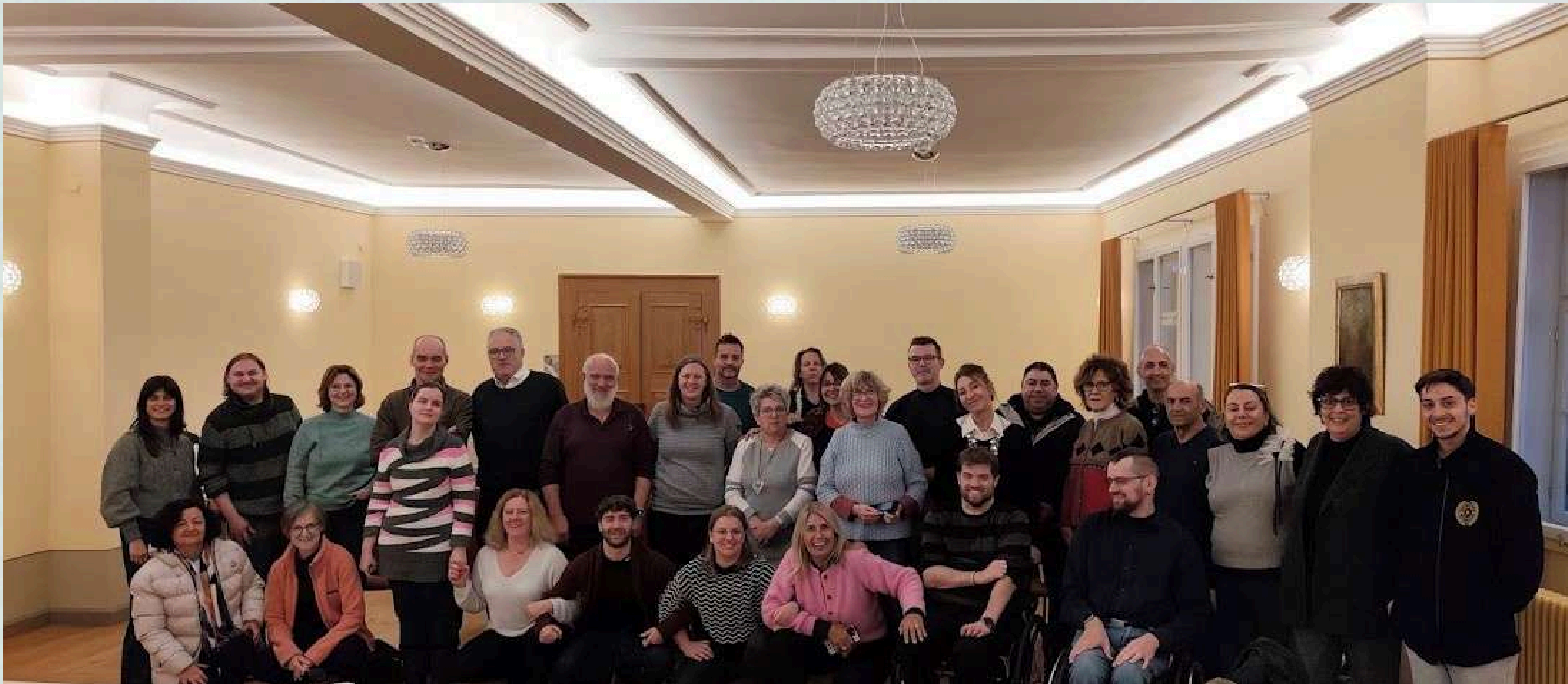
Fair Care en acción: Probando modelos de capacitación inclusivos que empoderan a las personas dentro de los sistemas de atención a largo plazo